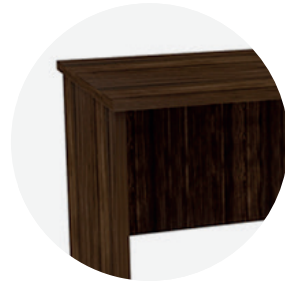
Madera de densidad media MDP